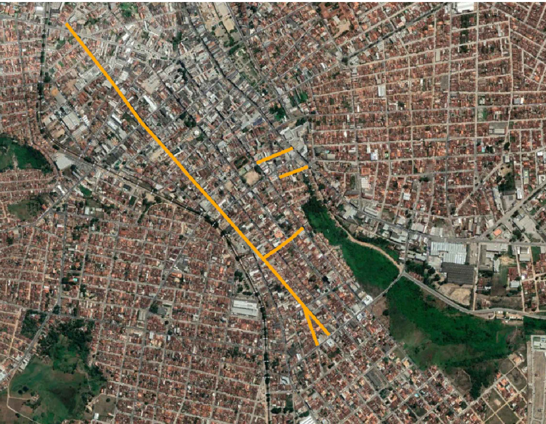
MAPA DE LOCALIZAÇÃO sem escola